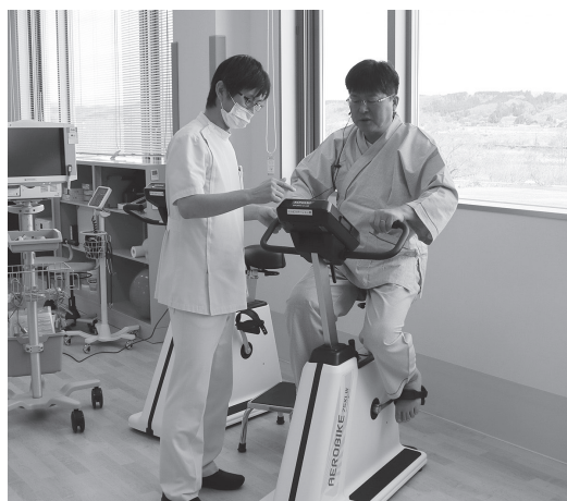
◀リハビリテーションのイメージ▶

今後も、岩出山地域のかかりつけ医機能を担い、本院や各分院・診療所と連携し、在宅支援の充実を図ることで、病院理念である市民が安心できる医療の提供に努めてまいります。