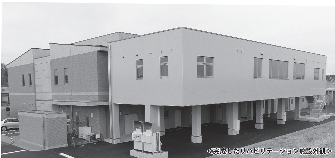
◀完成したリハビリテーション施設外観▶

岩出山分院のリハビリテーション施設は、「新大崎市民病院改革プラン」に基づき、2017年度から増築事業を進め、延床面積（2階）は266.4㎡、総事業費は約2億円で、本年3月に完成しました。