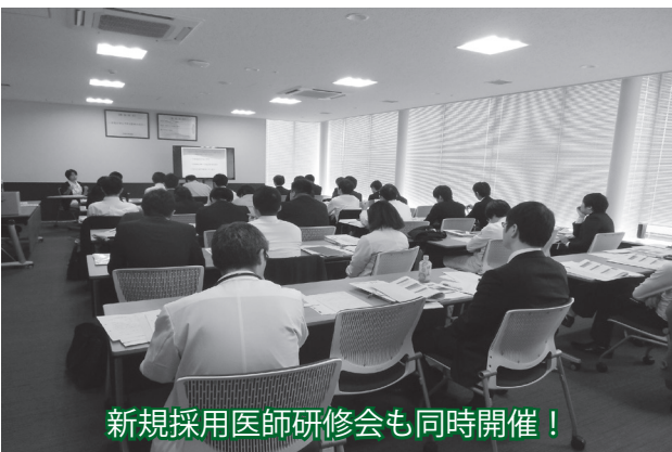
新規採用医師研修会も同時開催！

4月1日に新規採用職員112人に辞令を交付しました。研修会を開催し、管理者より病院理念や施設の概要についての講話を行いました。続いて社会人として求められる個人情報保護、メンタルヘルスケア、接遇研修、院内感染、医療安全の対策、経営状況や各部門におけるルール遵守事項の説明など、新規採用職員にとって必須となる様々な研修を行いました。 受講後の新規採用職員からは、「先輩の指導を受け、患者さんのために自分にできることを考え励みたい」「チームの一員として働くための姿勢、コミュニケーション