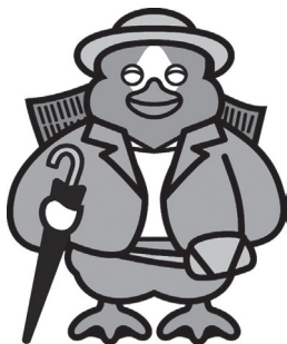
問 鹿島台分院管理課 ☎ 12611

以上を踏まえ、地域のニーズに柔軟に対応し、患者さん中心の医療・ケアを提供していきたいと思えます。