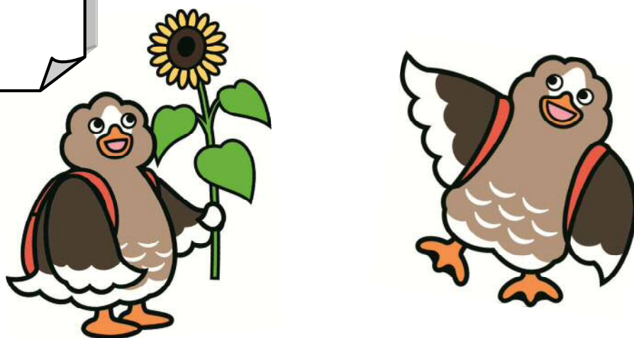
大崎市イメージキャラクター パタ崎さん