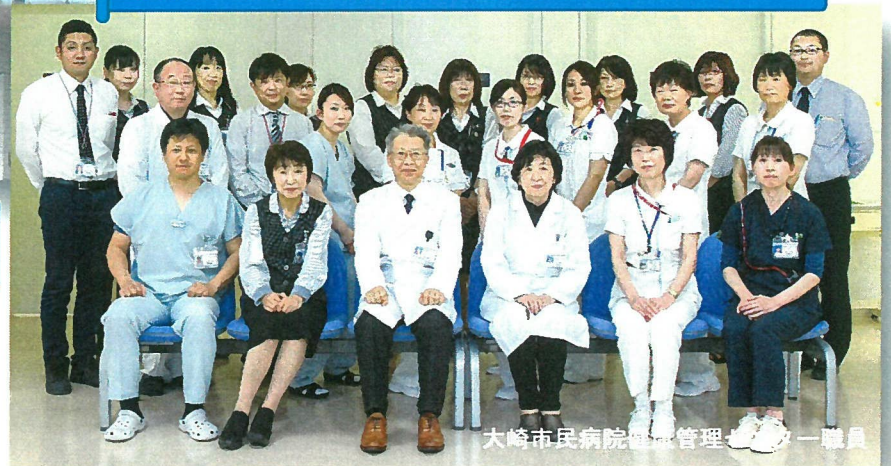
大崎市民病院健康管理センター職員