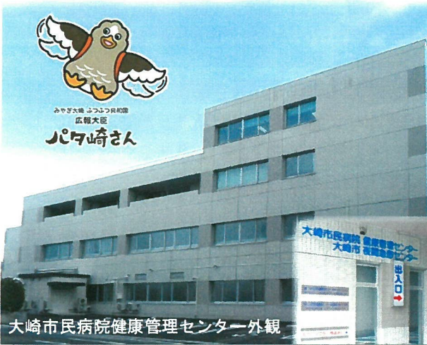
大崎市民病院健康管理センター外観