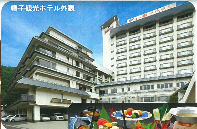
鳴子観光ホテル外観