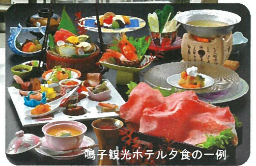
鳴子観光ホテル夕食の一例