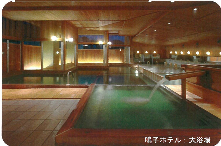
鳴子ホテル：大浴場