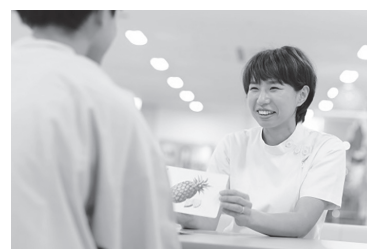
▲言語聴覚療法の様子

また、本院では心臓リハビリテーションにも力をいれています。急性心筋梗塞や心不全、末梢動脈疾患などの心臓の病気に対する運動療法や、術前術後の患者さんに対して適切な運動量を検査し、早期離床に向けた運動プログラムを提案し、実施しています。