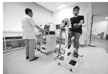
▲心臓リハビリテーションの様子