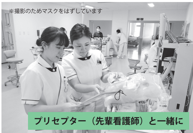
プリセプター（先輩看護師）と一緒に