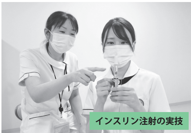
インスリン注射の実技