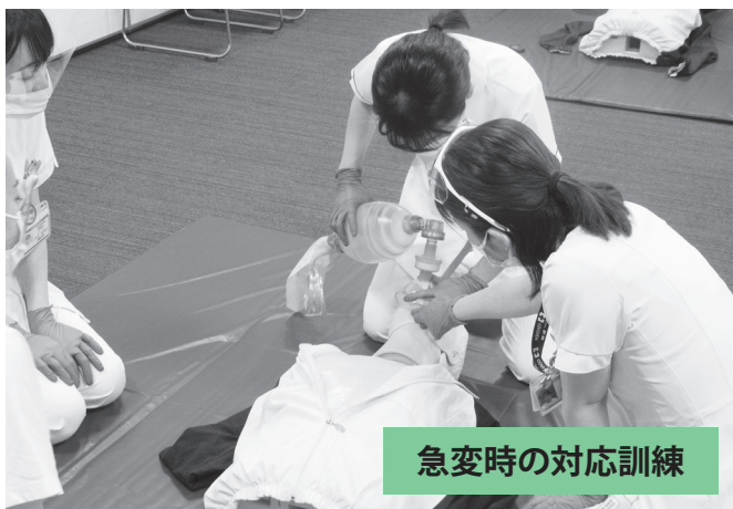
急変時の対応訓練