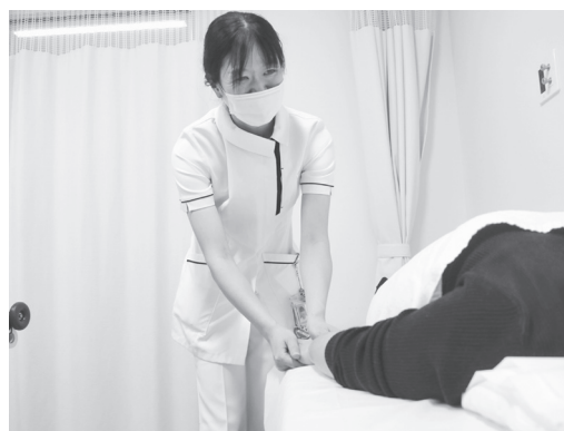
▲リンパマッサージの様子