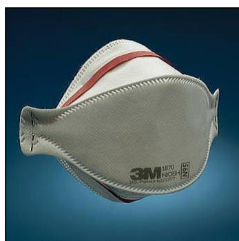
N95 マスクのイメージ