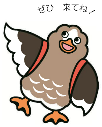
大崎市イメージキャラクター パタ崎さん