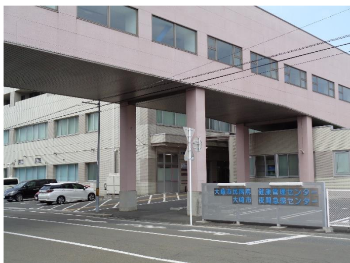
（遠くから見たとき）