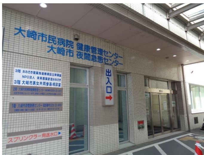
（近くから見たとき）