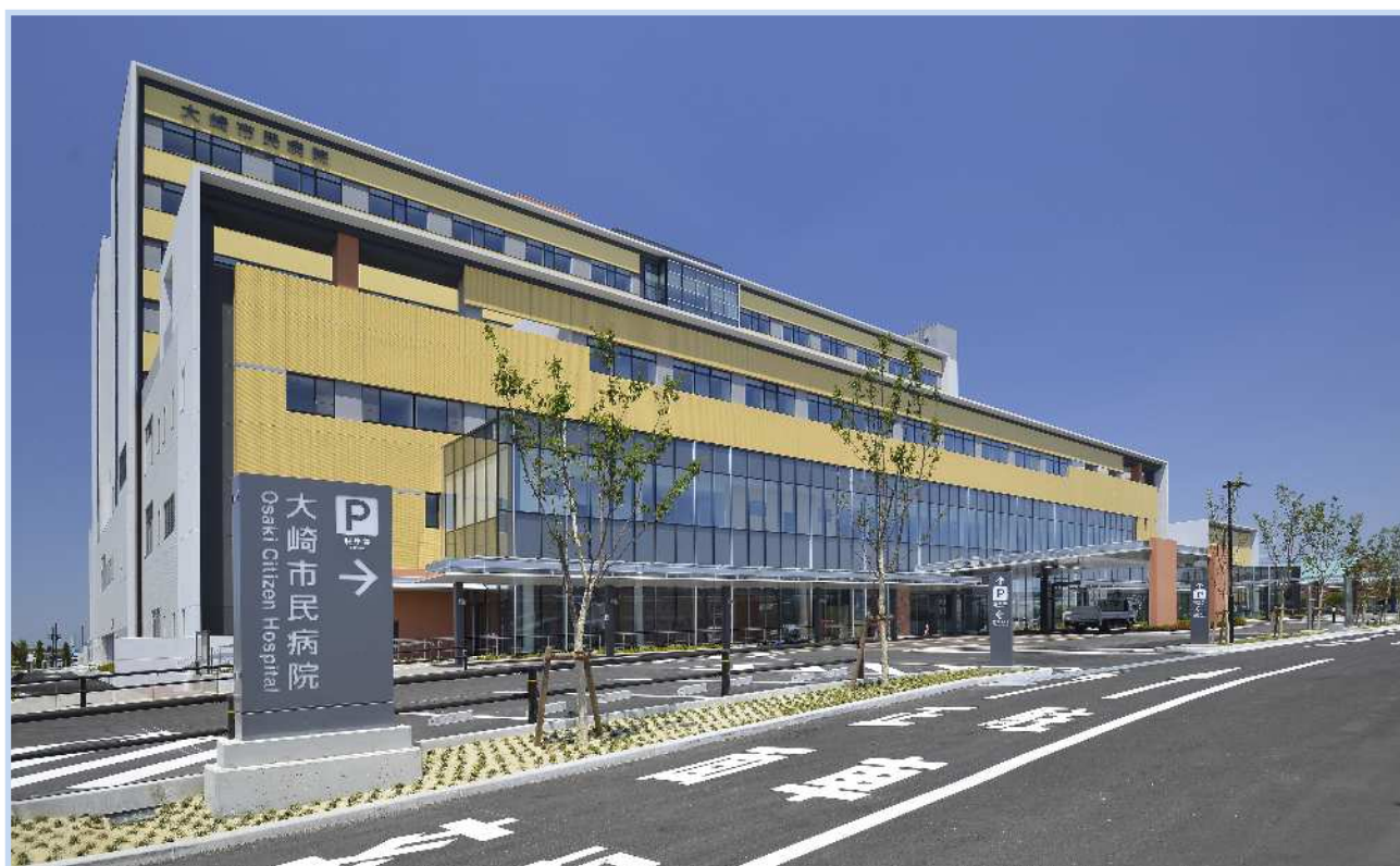
大崎市市民病院 本院